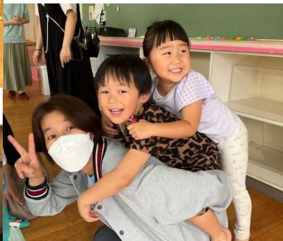
光明府中南保育園