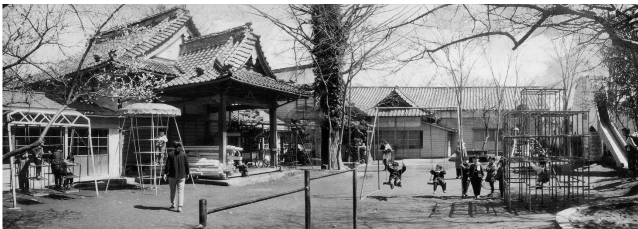
開園当初の光明保育園・雲龍寺境内