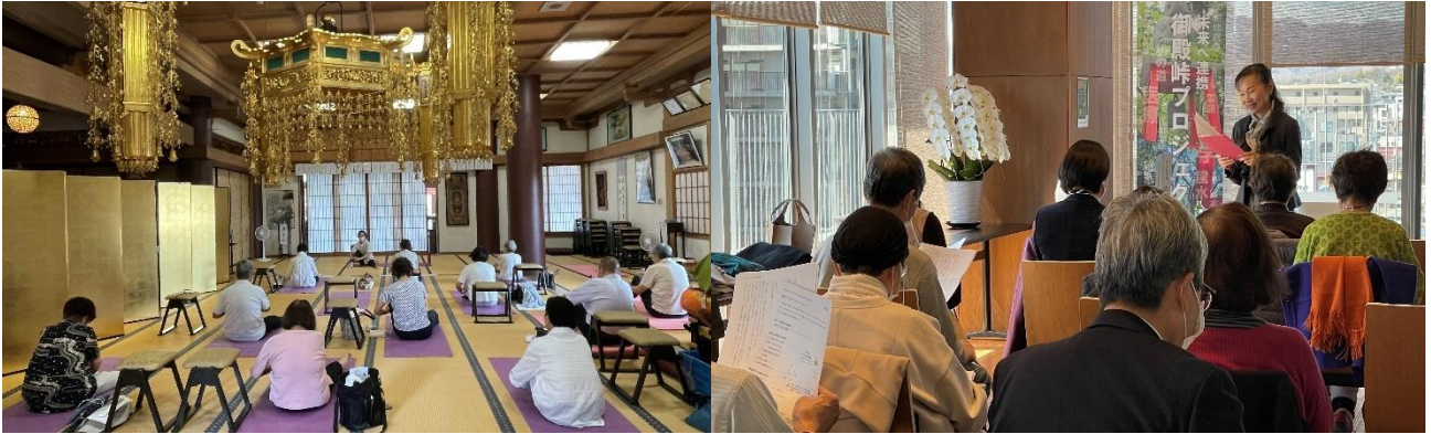
令和5年9月28日 お寺でヨガ

令和5年度は、光明塾と共同開催で年10回の講座を行いました。また、平成21年度卒業生の二十歳を祝う同窓会を開催し、卒業生と担任が参加。懐かしいムービーや写真を見ながらおしゃべりを楽しみ、和やかなひと時を過ごしました。