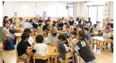
光明第四こども園