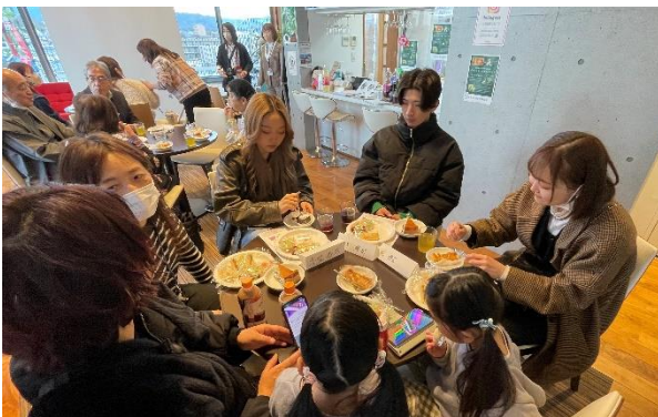
令和6年3月2日 二十歳を祝う同窓会